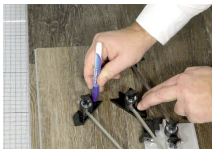
Abb 3+4. Anschließend werden die Eckpunkte auf das zu schneidende Element übertragen und ausgeschnitten.