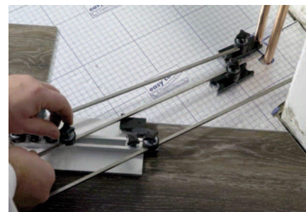
Abb 2. Die entsprechenden Eckpunkte oder Radien abtasten und die Auslege- stangen und Taster mittels der Rändelschraube fixieren.